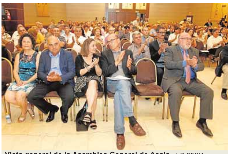
Vista general de la Asamblea General de Asaja.